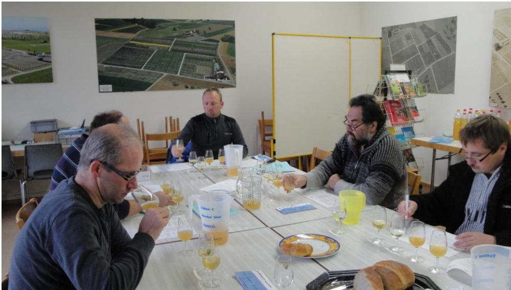
Degustatoren des Thurgauer Süssmosterverbandes

Am 15. Februar 2011 erfolgten anlässlich der Generalversammlung des Thurgauer Süssmosterverbandes das Absenden des Qualitätswettbewerbes und die Rangverkündigung.